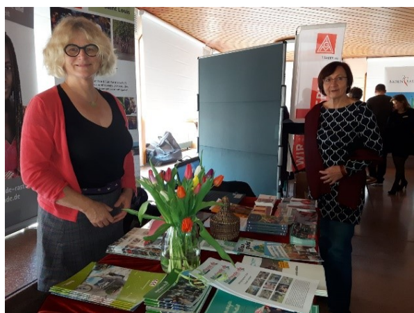
Informationsstand anlässlich der Jubiläumsfeier 100 Jahre Frauenwahlrecht, Rastatt