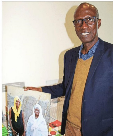
KLIMAWANDEL IM BLICK: Mamadou Mbodji, Präsident des „African Nature-Friends Network“, macht dieser Tage Station in Rastatt.

Anfang 2014 hatte die Ortsgruppe eine „kommunale Klimapartnerschaft“ zwischen Rastatt und Saint Louis auf den Weg gebracht, die der Rastatter Gemeinderat im Herbst 2015 mit denkbar knapper Mehrheit stoppte und in diesem Jahr wieder aufgenommen hat (die BNN berichteten). Trotz des damaligen Stopps hatten die Naturfreunde, wie zu erfahren war, unbeeinträchtigt an gemeinsamen Klimaprojekten weitergearbeitet und ökologische, soziale und kulturelle Vorhaben unterstützt. Dazu zählen der Einsatz und die Erschließung erneuerbarer